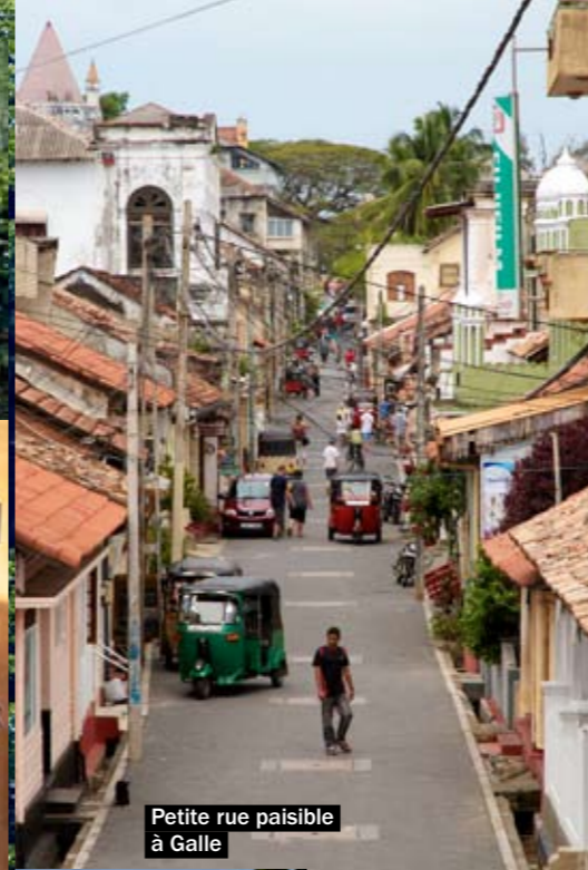
Petite rue paisible à Galle