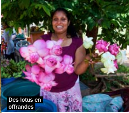
Des lotus en offrandes