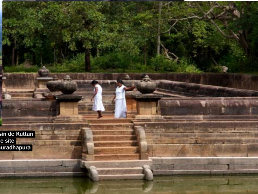
Bassin de Kuttan sur le site d'Anuradhapura