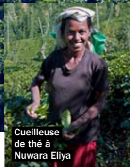
Cueilleuse de thé à Nuwara Eliya

On dirait la montagne brodée main. Dans la région de Nuwara Eliya et Kandy, les rizières en terrasses dessinent un gigantesque édredon. Sir Lipton a fait fortune grâce au thé de Ceylan. Les petites factories (manufactures) toujours en activité, se visitent. Ça sent l'herbe fraîchement coupée juste avant la fermentation. La poussière ( dust ), noire et forte, est réservée au marché local. Tout le reste (95 % de la production), comme le fameux Broken Orange Pekoe, prisé par les Anglais – avec un nuage de lait – est destiné à l'exportation.