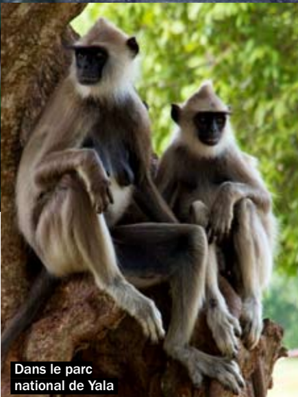
Dans le parc national de Yala