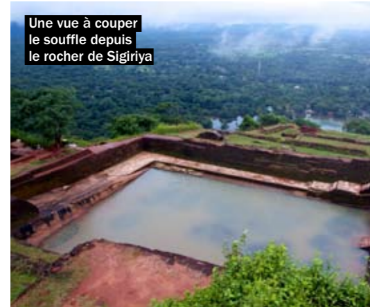
Une vue à couper le souffle depuis le rocher de Sigiriya