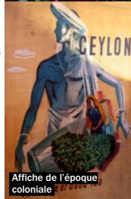
Affiche de l'époque coloniale