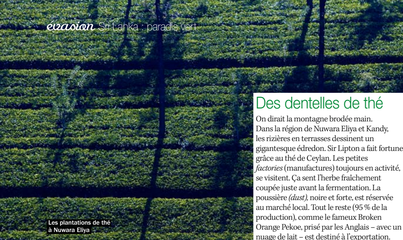
Les plantations de thé à Nuwara Eliya