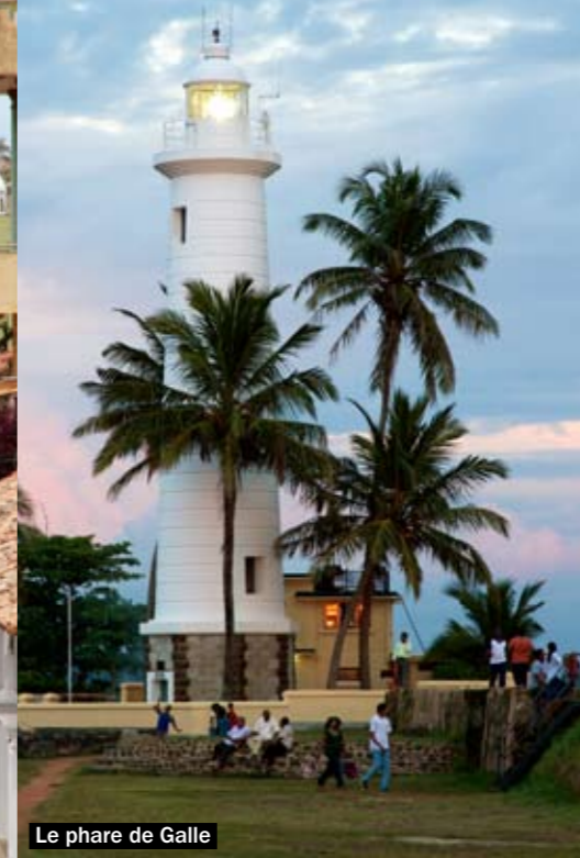
Le phare de Galle