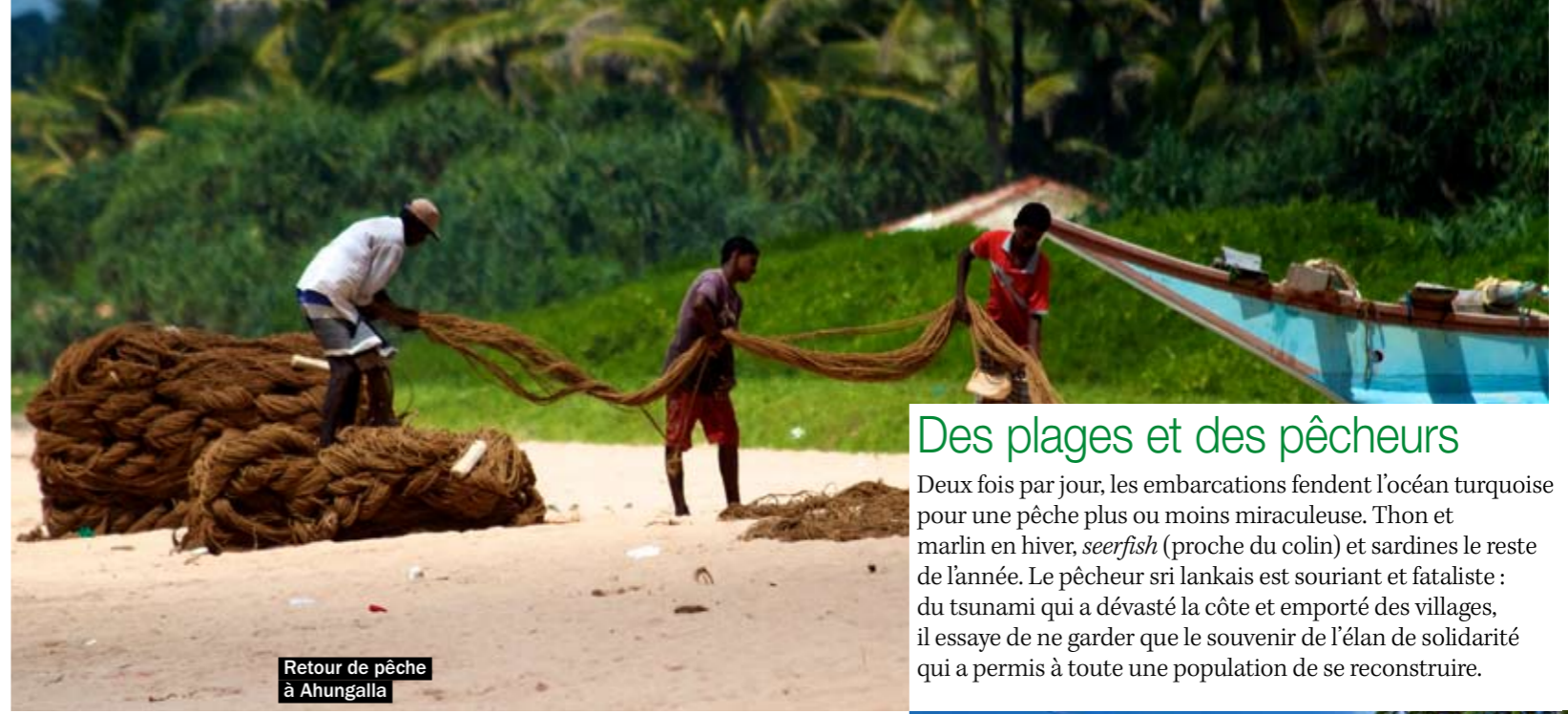
Retour de pêche à Ahungalla

Ici, la piété est joyeuse et bariolée. Les Sri Lankais sont en majorité bouddhistes (70 %). Une philosophie plus qu'une religion, dont la pratique rythme la vie de chacun. A chaque pleine lune ( pooya ), on fait la fête, avec défilés et processions d'éléphants. Près des temples, sous l'œil gourmand de singes charpentiers, des femmes vendent leurs offrandes : des boutons de lotus fraîchement déployés.