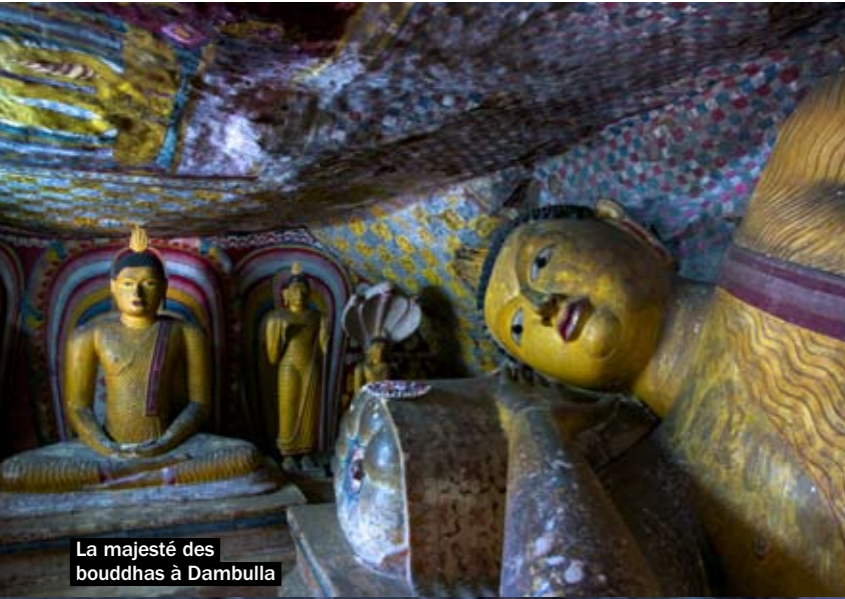
La majesté des bouddhas à Dambulla