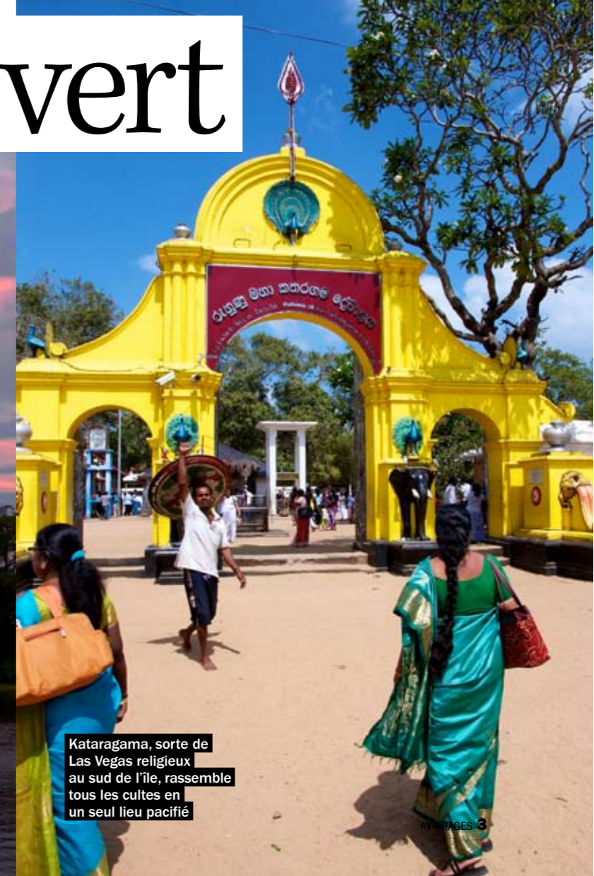
Kataragama, sorte de Las Vegas religieux au sud de l'île, rassemble tous les cultes en un seul lieu pacifié

Des temples époustouflants, des montagnes capitonnées de thé, des plages dorées ourlées de parcs naturels, une certaine élégance british... L'île « Cannelle », au sud-est de l'Inde, a retrouvé le sourire après un tsunami et des années de conflits ethniques. Ceylan... c'est doux. par Isabelle Bourgeois