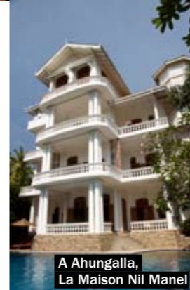
A Ahungalla, La Maison Nil Manel