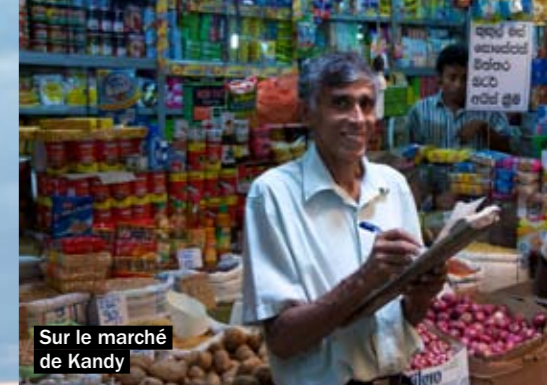
Sur le marché de Kandy