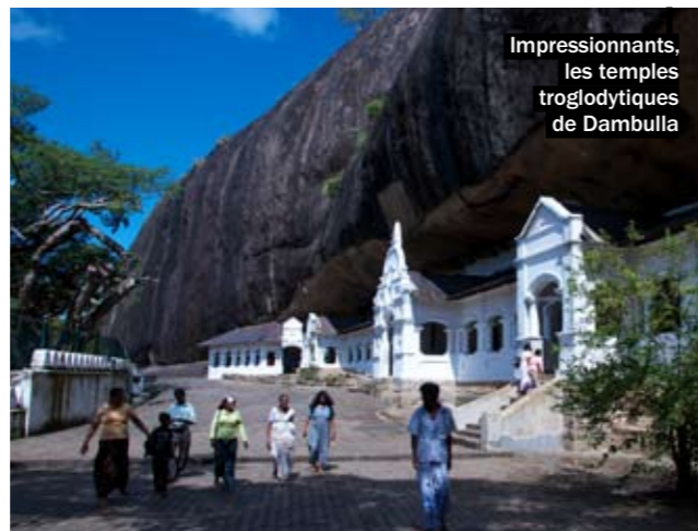
Impressionnants, les temples troglodytiques de Dambulla

C'est au centre de l'île, dans la région d'Anuradhapura, que bat le cœur culturel et archéologique. Autant prévenir, mieux vaut avoir de bons mollets et du souffle pour arpenter les kilomètres (à pied ou à vélo) de ces anciennes villes royales – dont certaines datent du IV e siècle av. J.-C. –, gravir les escaliers de la forteresse de Sigiriya perchée sur un rocher ou accéder aux temples troglodytiques de Dambulla, dont la splendeur des bouddhas sculptés à même la roche et des plafonds peints (XVIII e siècle) de damiers psychédéliques mérite bien un petit effort.